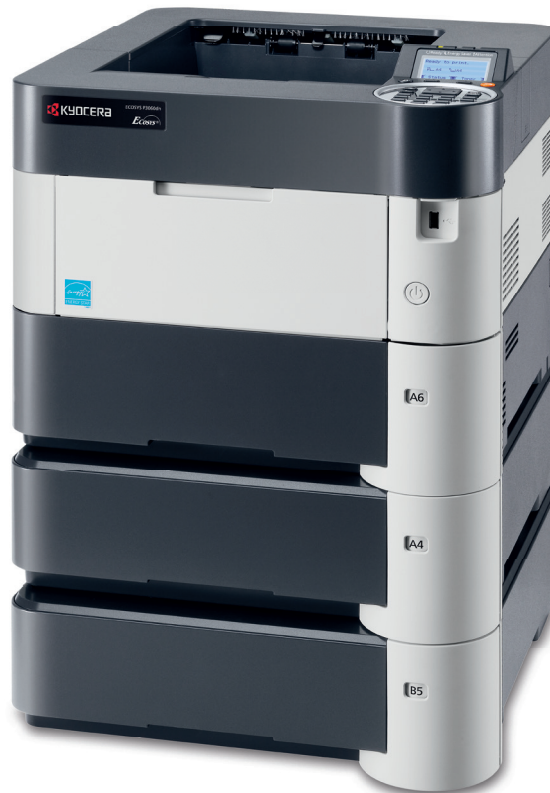
Abbildung mit Option.