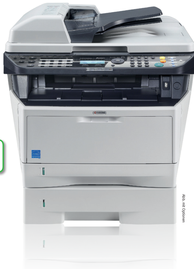
Abb. mit Optionen