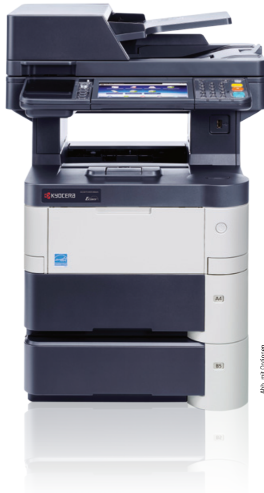
Abb. mit Optionen